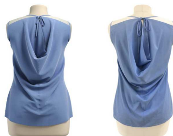
3Dサンプル 実物サンプル

オンラインミーティングツールの画面共有により テレワークでの業務効率が飛躍的に向上します