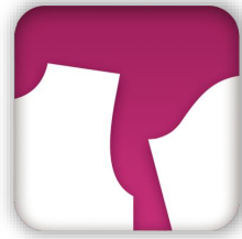
アパレルCAD Alpha myu