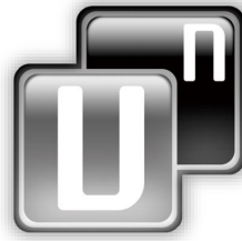
企画生産情報管理 Unify